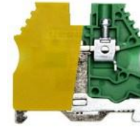
AVK 2,5 / 4T - AVK 16 / 35T