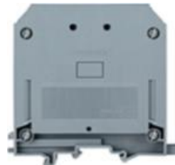
AVK 95 - 240mm 2

Ruuviriviliittimet, 95 mm 2 - 240 mm 2 , AVK-sarja, suurille virroille, 1000V, 232 - 415A