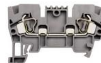
YBK 2,5 - 10 mm 2