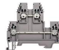
PIK 2.5 ja PIK 4

Valikoimissamme myös muita 2-kerrosliittimiä!!