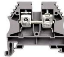
AVK 2,5 - 10 mm 2