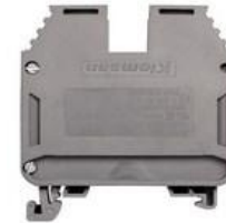
AVK 35mm 2