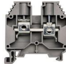
AVK 16mm 2