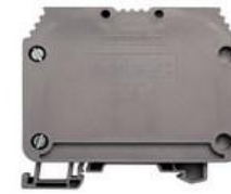
AVK 50 - 70 mm 2