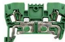
YBK T 2,5 - 10 mm 2